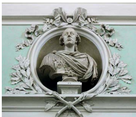
Busto di Pietro Leopoldo agli Uffizi di Firenze

Il casato è quello degli Asburgo-Lorena e lui è solo il nonno di quel Leopoldo – anzi, Leopoldo Il Giovanni Giuseppe Francesco Ferdinando Carlo – che forse non era neanche il più carognone del casato, magari si sarebbe contentato di campare negli agi facendo il bagno davanti alla Terrazza Mascagni, se non fosse che fare il bagno era una usanza strana (tutt'al più su ordine del medico) e il lungomare di Livorno non esisteva ancora per come lo conosciamo oggi. Quel granduca Leopoldo che, travolto dall'ondata rivoluzionaria toscana, finì per causare l'arrivo dell'armata più potente del mondo di allora e – manco a dirlo, pare su istigazione d'una spia pisana – scatenare l'iradiddio contro quei ribelli dei livornesi.