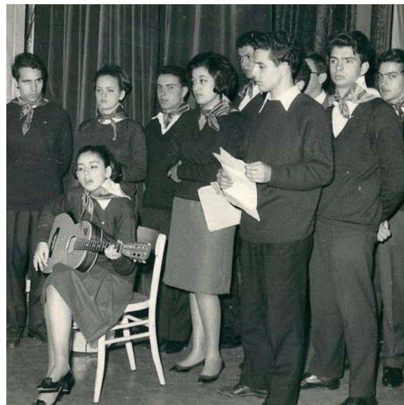
Alla Gran Guardia omaggio cantato alla delegazione antifranchista