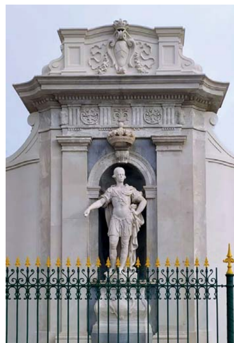
Statua in piazza S. Jacopo in Acquaviva a Livorno

In realtà sì, però bisogna farlo restituendo alle cose la loro profondità storica: davvero giudichereste una civiltà sostanzialmente pre-industriale con il metro dell'oggi fatto di smartphone, automazione e intelligenza artificiale? Ecco perché mi tengo stretto quel che ha significato la disperata difesa di Li-